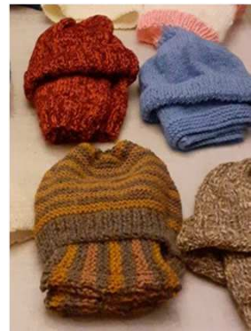
tuques et mitaines