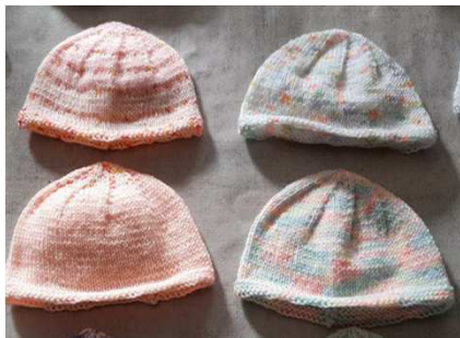
bonnets bébé au tricot