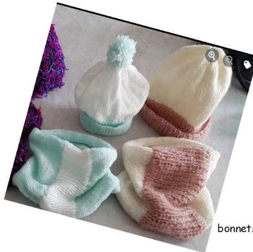
bonnets et snoods au tricot